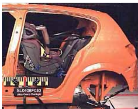
Seggiolino montato in direzione opposta al senso di marcia

In caso di incidente, il bimbo è protetto dallo schienale dei sedili anteriori, la testa non è soggetta a movimenti troppo violenti e l'addome non si comprime a causa delle cinture di sicurezza del seggiolino per auto.